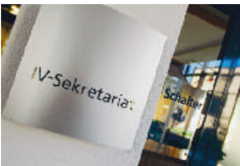
Gesetzgebung. Kostendämpfung bei der Invalidenversicherung. Seite 7