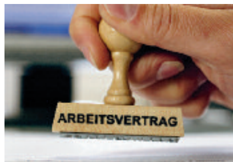
Sozialpartnerschaft. Arbeiten weit fortgeschritten. Seite 11