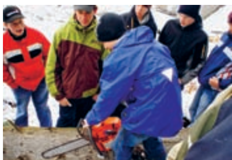
Werkplatz. Arbeitsplatz Liechtenstein – Teil 2. Seite 12