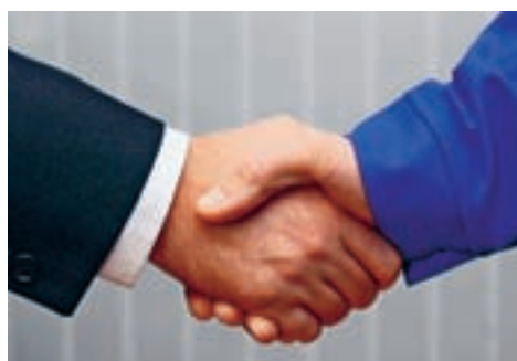
Dienstleistung. Mediation in Liechten- stein. Seite 15