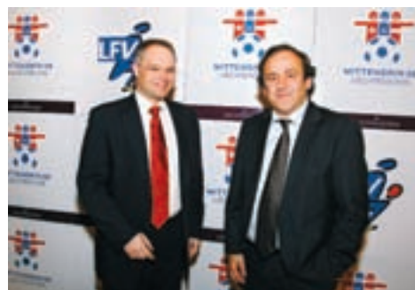
Ressort Wirtschaft. EM 2008 – Die Chance für Sport und Gewerbe. Seite 21

Alt – aber umweltfreundlich neu. Baumeister-Apéro zum Thema Baustoff-Recycling. Seite 8