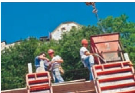
Sozialpartnerschaft. Neue Gesamtarbeitsverträge in Kraft getreten. Seite 10