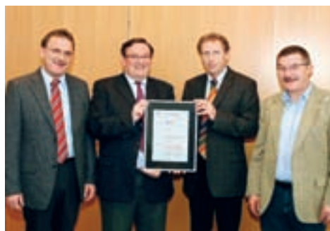
Sozialfonds. Sozialfonds mit Best Board Practice Label ausgezeichnet. Seite 21