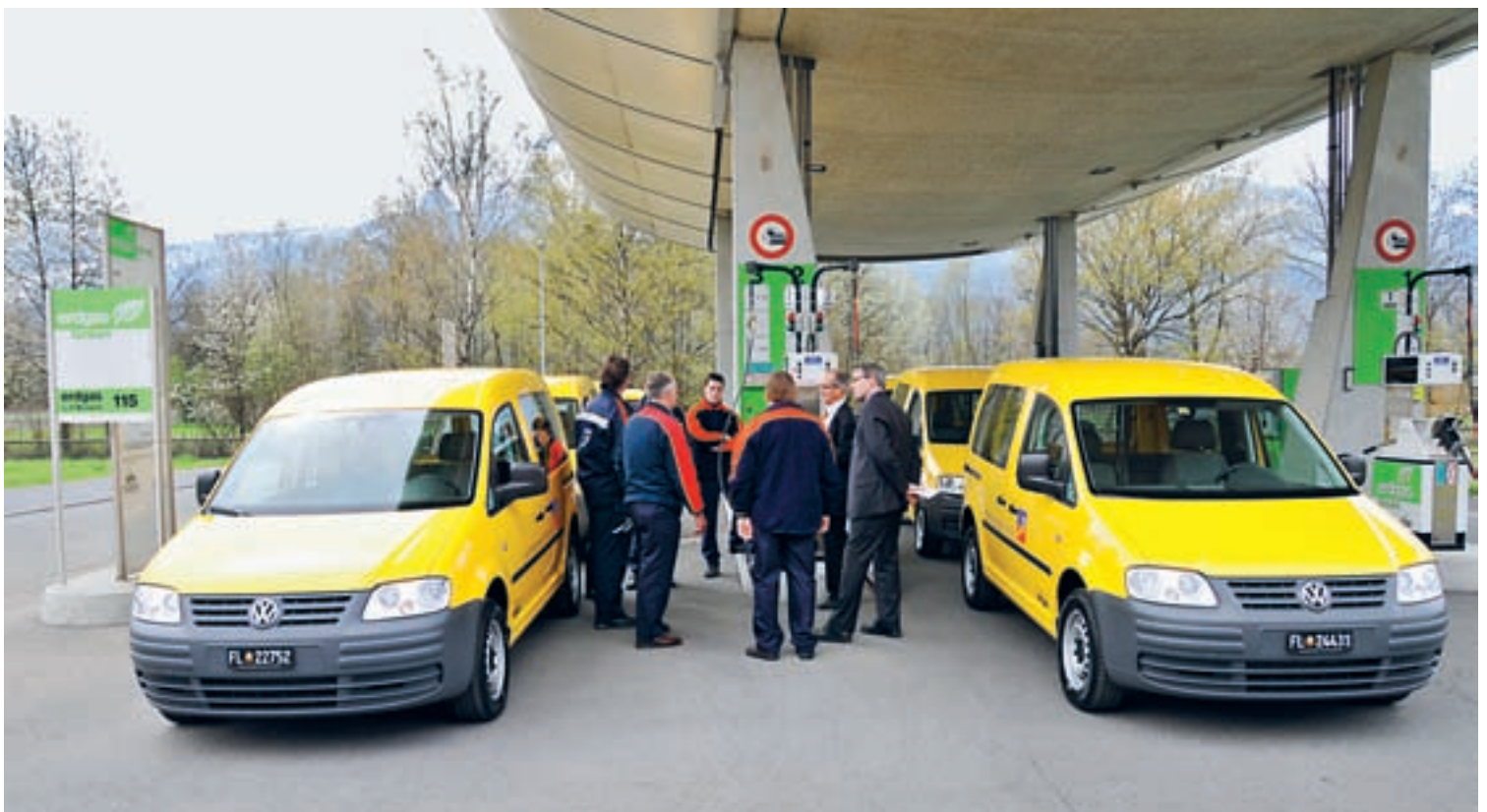
Erläuterungen an die Benutzer der Erdgasfahrzeuge an der Tankstelle in Vaduz