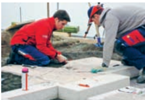
WorldSkills. Internationale Berufsweltmeisterschaften in Kanada 2009. Seite 11