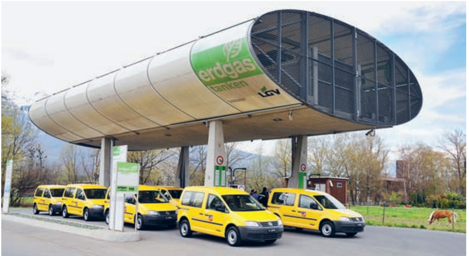
Die Erdgasflotte der Liechtensteinischen Post AG (gesamthaft 9 Erdgasfahrzeuge)