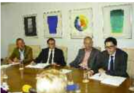
Wirtschaft. Gesetzesinitiative zum Mobilfunk lanciert. Seite 11