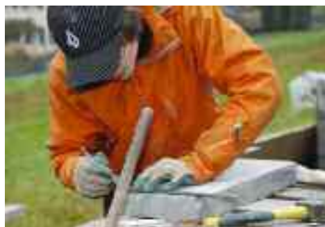
Ressort Wirtschaft. Bekämpfung der Jugendarbeitslosigkeit. Seite 23

Wirtschaft. Für die Sicherung der Standortattraktivität. Seite 7